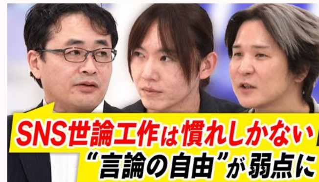
情報戦の解説 Abema Prime（2025年2月14日）にて放映